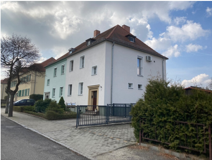
Wohnhaus der Gartenstadt Lauta-Nord