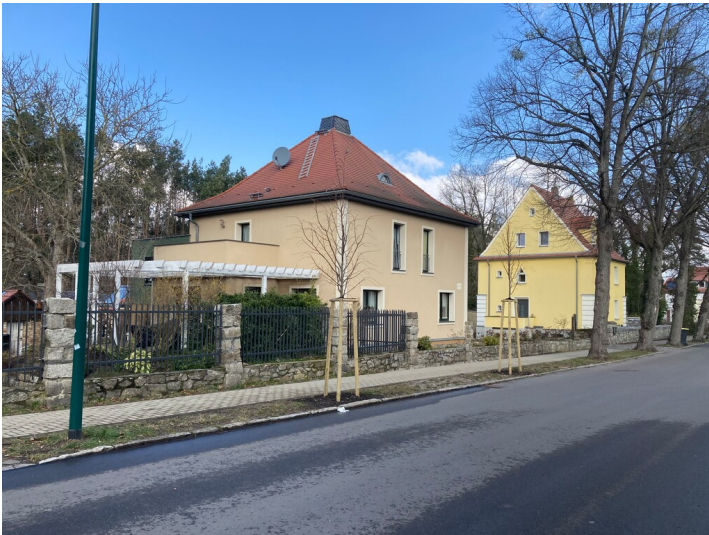
Wohnhaus der Gartenstadt Lauta-Nord