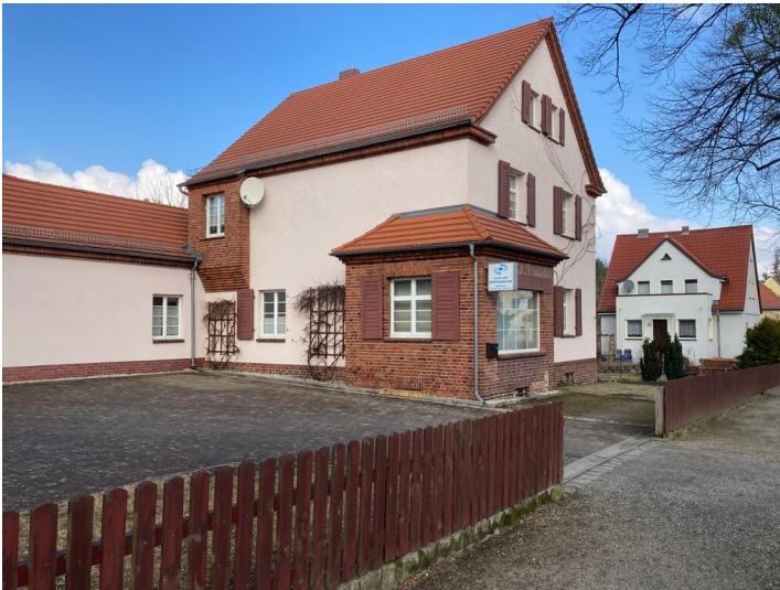
Wohnhaus Lauta-Nord, Weststraße 3, 5