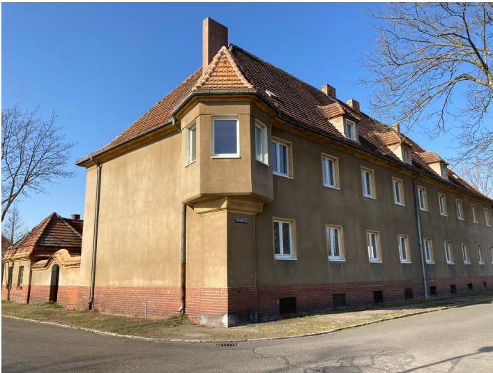
Wohngebäude Nordstraße 7 der Kolonie Erika