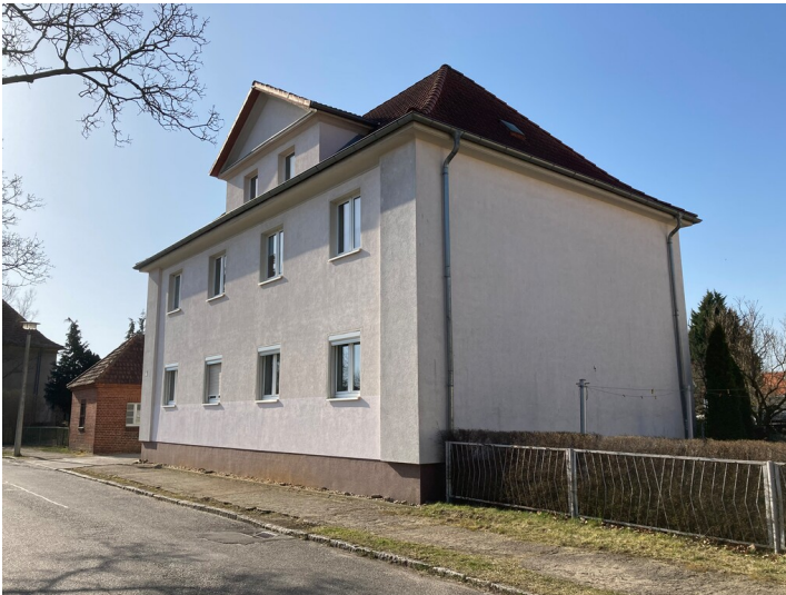
Wohnhaus Nordstraße 6 der Kolonie Erika