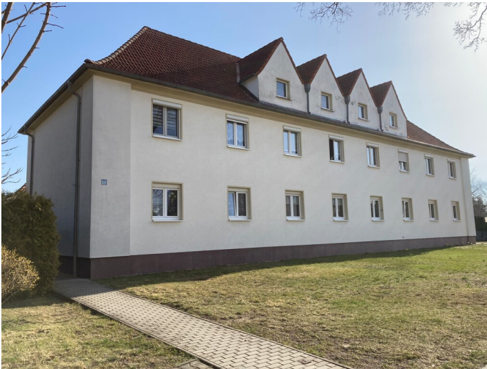
Wohnhaus Nordstraße 10 der Kolonie Erika