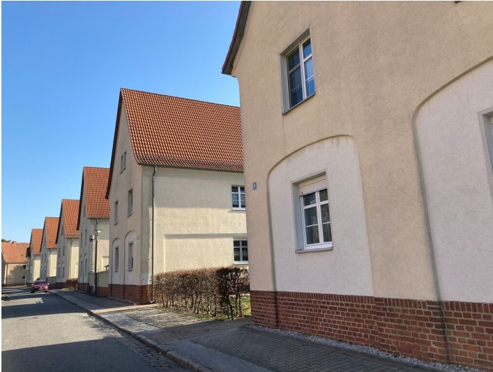
Wohnhäuser Am Markt 1- 6 in Laubusch