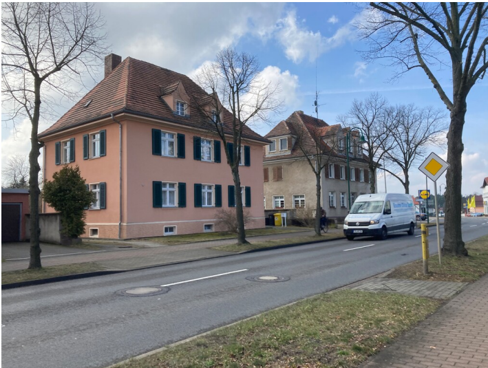
Wohnhaus Lauta-Nord, Straße der Freundschaft 53