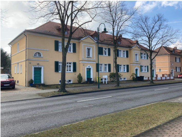
Wohnhaus Lauta-Nord, Straße der Freundschaft 54-61