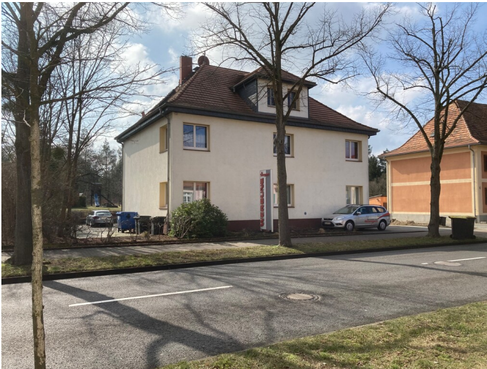
Wohnhaus Lauta-Nord, Straße der Freundschaft 68