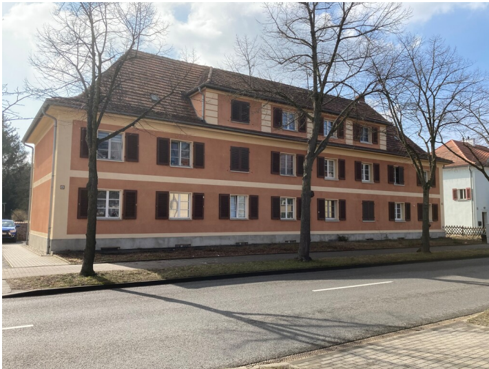
Wohnhaus Lauta-Nord, Straße der Freundschaft 66, 67