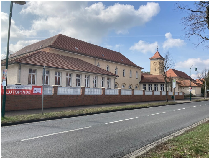
Nordschule Lauta für die Kinder Arbeiter und Angestellten der Vereingten Aluminiumwerke Lauta VAW

Schlagwörter: Schulgebäude Fachsicht(en): Denkmalpflege Gemeinde(n): Lauta Kreis(e): Bautzen Bundesland: Sachsen