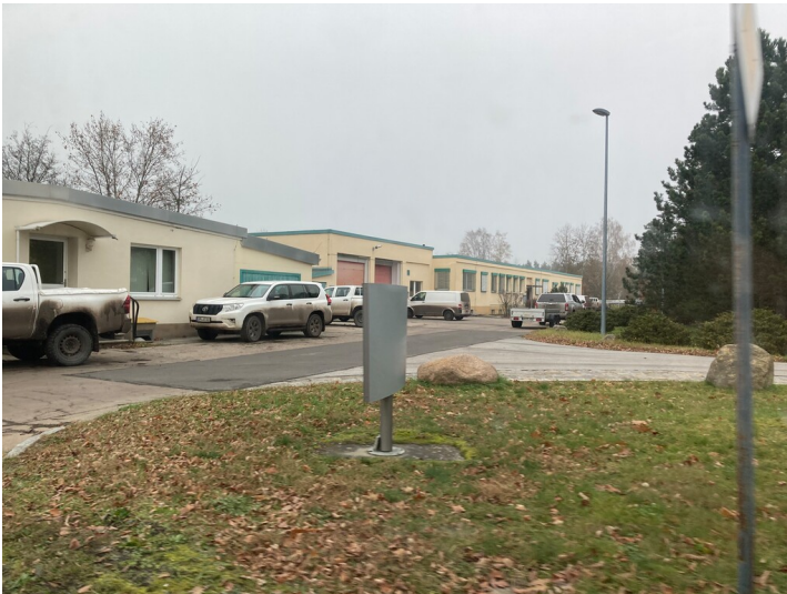
Tagesanlagen des Tagebaus Nochten in Mühlrose