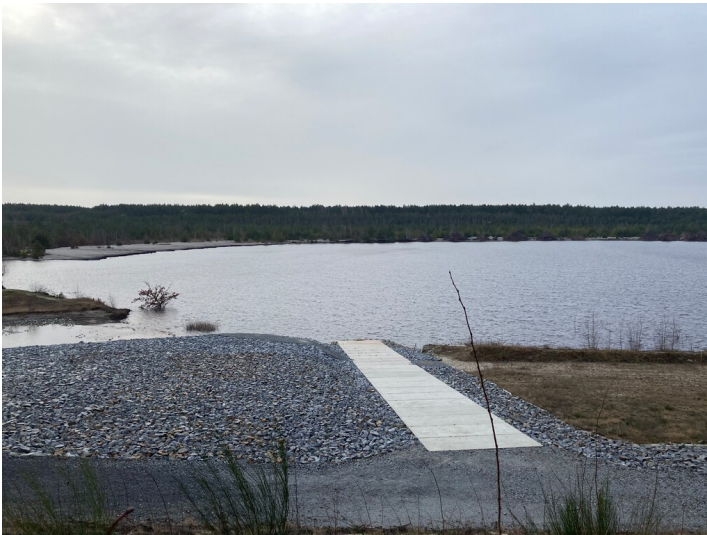
Blick von Norden auf den Blunoer Südsee in der Nähe des Blunodammes