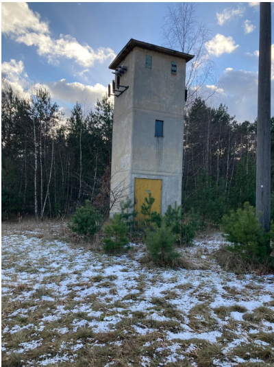
Transformorenturm und Transformorenstation