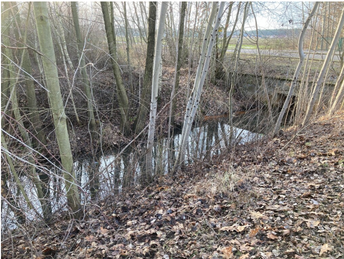
Umverlegte Struga