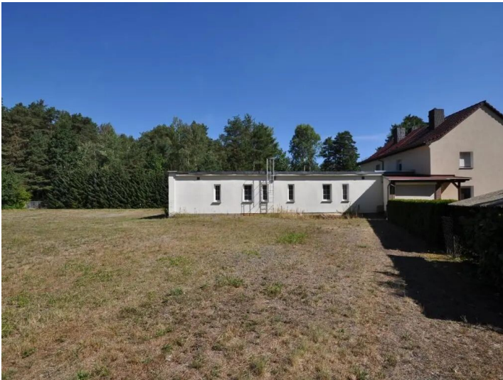
Wasserwerk Schleife