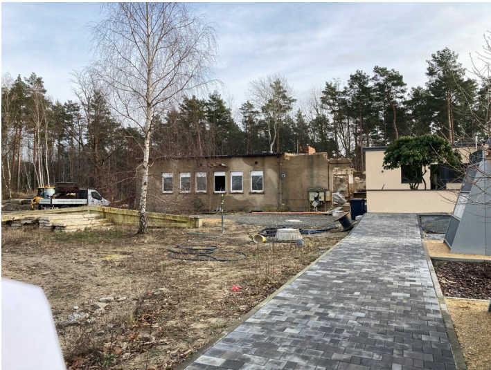
Tagesanlagen des ehemaligen Tagebaus "Trebendorfer Felder"