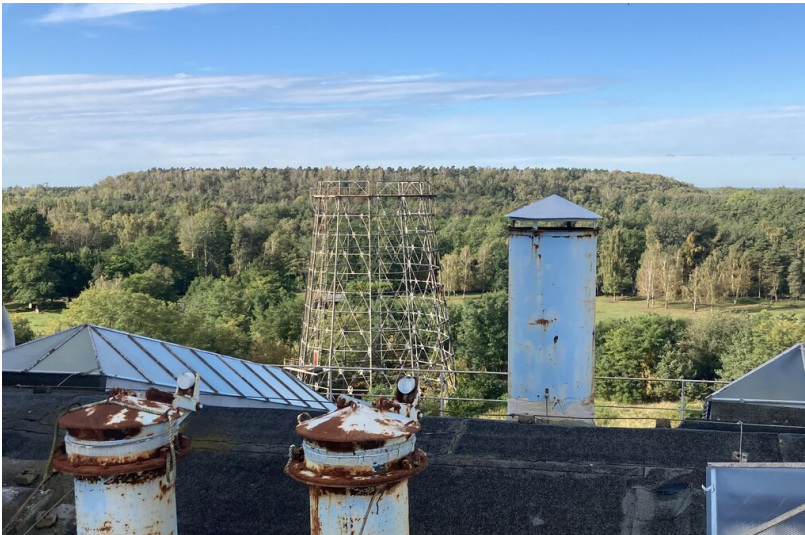
Außenkippe des Tagebaus Werminghoff I