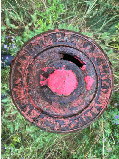
Hydrant der Werkssiedlung Werminghoff