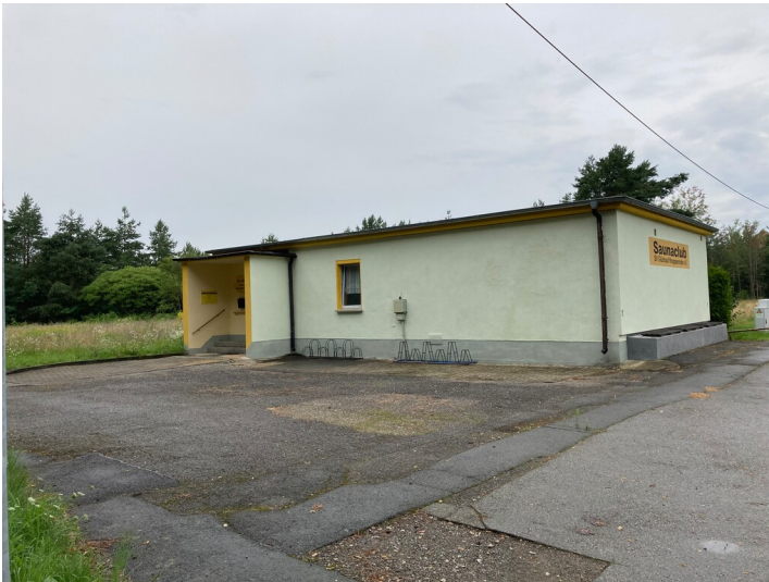
Saunaclub der Werkssiedlung Knappenrode