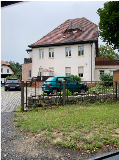
Direktorenvilla für den Leiter der Brikettfabrik Knappenrode