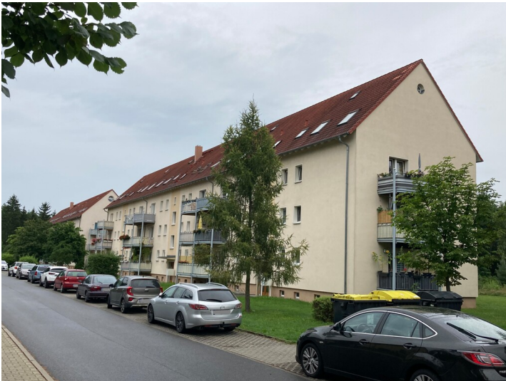
Wohnblock für Mitarbeiter der Brikettfabrik