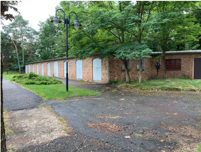
Unterstellgebäude der Brikettfabrik Werminghoff