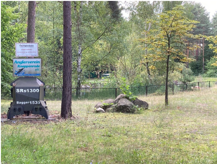
Freibad der Werksiedlung Knappenrode