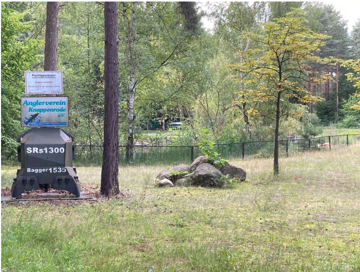
Freibad der Werkssiedlung Knappenrode