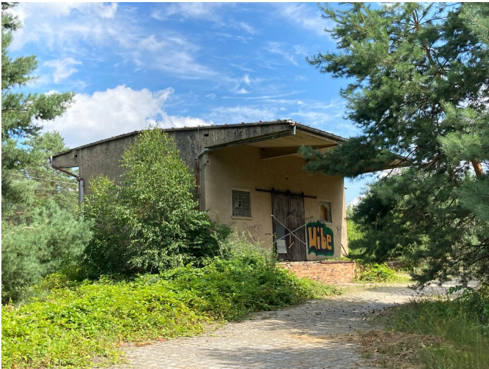
Umladeschuppen Knappenrode