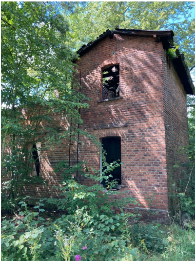
Bahnwärterhaus Bahnhof Knappenrode