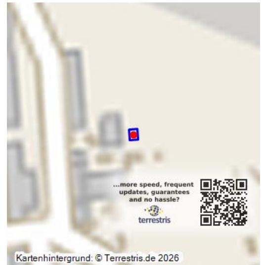
Barbarakapelle, (Lager für Arbeitsmittel) erbaut 1914, diente bis 1945 der Aufbahrung tödlich verunglückter Bergleute, bis 1993 Wäschestützpunkt und Wäscheausgabestelle der Bergleute, 1999 erneuert und geweiht

Die 1914 auf dem Gelände der Brikettfabrik Werminghoff errichtete Barbarakapelle diente bis 1945 der Aufbahrung tödlich verunglückter Bergleute. Während der Zeit des VEB Braunkohlenwerk Glückauf bis 1993 diente das Gebäude als Wäschestützpunkt und Wäscheausgabestelle der Bergleute und als Lager für Arbeitsmittel.