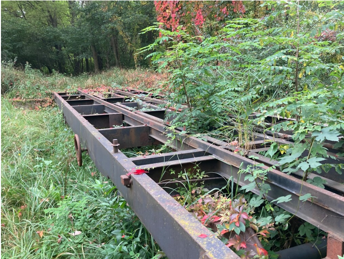
Überladerampe der Brikettfabrik Werminghoff in Knappenrode