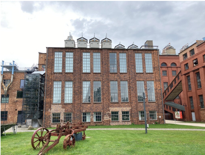
Kühlhaus IV der Brikettfabrik Werminghoff in Knappenrode