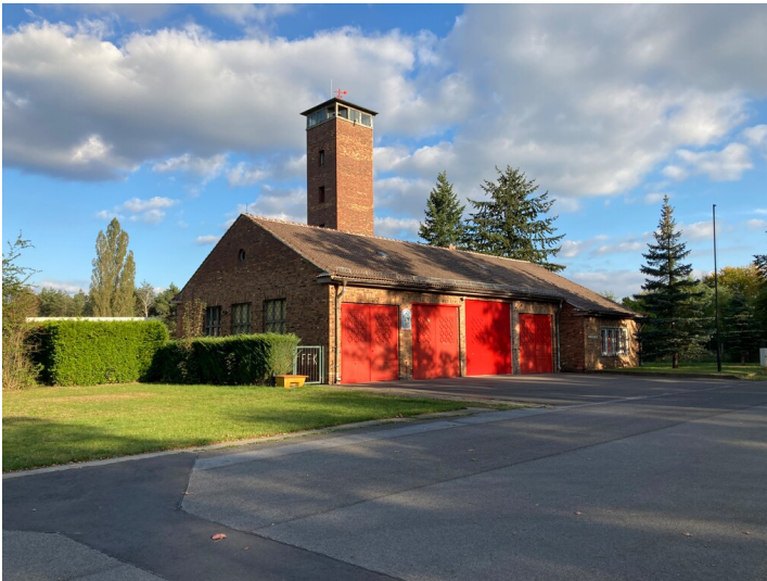
Werksfeuerwehrgebäude der Brikettfabrik Werminghoff in Knappenrode