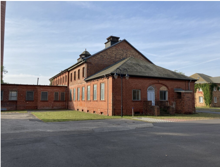
Zechenhaus der Brikettfabrik

Schlagwörter: Brikettfabrik Fachsicht(en): Denkmalpflege Gemeinde(n): Hoyerswerda Kreis(e): Bautzen Bundesland: Sachsen