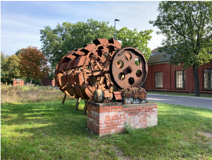
Schaufelräder auf dem Gelände der Brikettfabrik

Schlagwörter: Schöpfwerk Fachsicht(en): Denkmalpflege Gemeinde(n): Hoyerswerda Kreis(e): Bautzen Bundesland: Sachsen