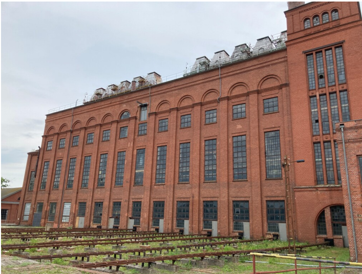
Fabrik II mit Kühlsträngen

Schlagwörter: Brikettfabrik Fachsicht(en): Denkmalpflege Gemeinde(n): Hoyerswerda Kreis(e): Bautzen Bundesland: Sachsen