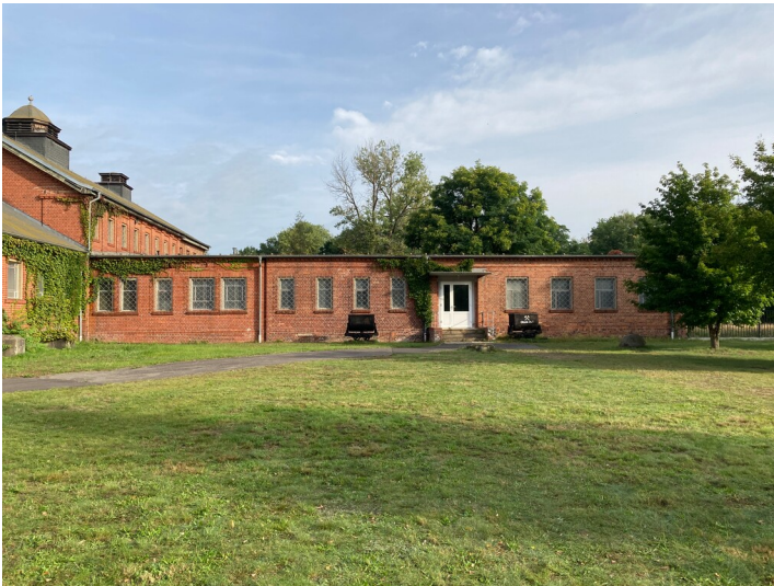
Männerbad - Waschkaue der Brikettfabrik Knappenrode