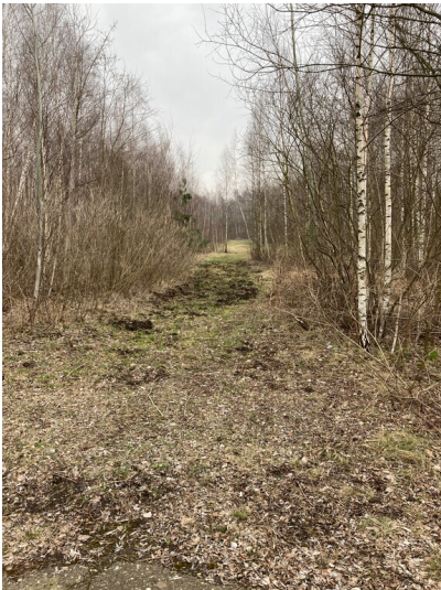
Teil der Objektgruppe Halde Trages (30600141), ehemaliger Schießplatz