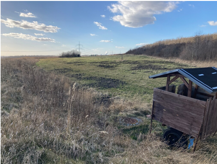
Teil der Objektgruppe Halde Trages (30600141), Ehemalige Aschekippe des Braunkohlenwerks Espenhain