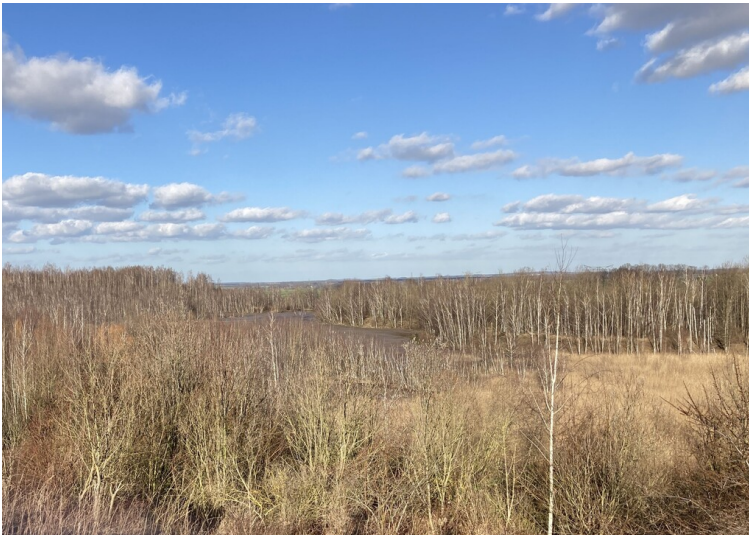
Teil der Objektgruppe Halde Trages (30600141), Absetzbecken der Halde Trages