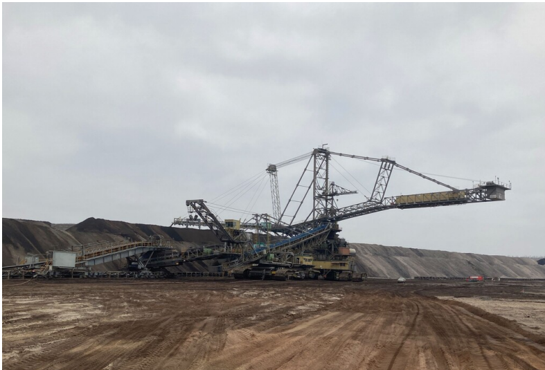
Bandabsetzer A2Rs-B 10.000.110 mit Gerätenummer 1119