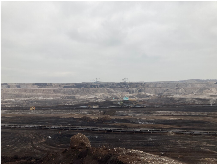
Tagebau Vereinigtes Schleenhain, Abbaufeld Schleenhain, Blick nach Osten