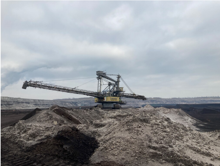
Bandwagen 832 BRs 1600