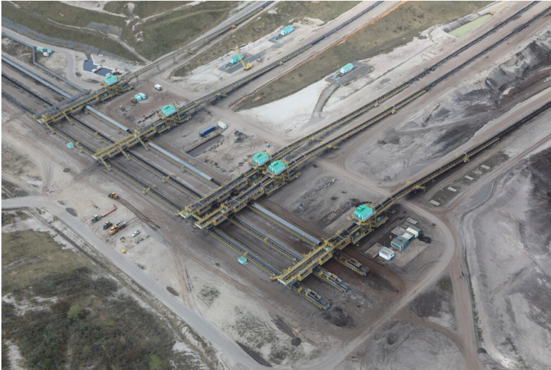
Massenverteiler mit sechs Verschiebeköpfe, Luftbild