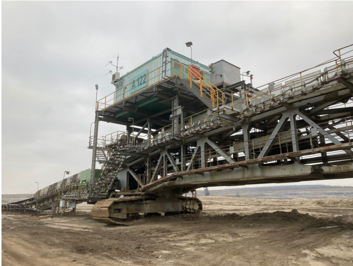
Antriebsstation mit Umlenkstation der Bandanlagen in Strosse 1