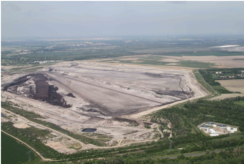
Tagebau Vereinigtes Schleenhain, Blick über Abbaufeld Peres