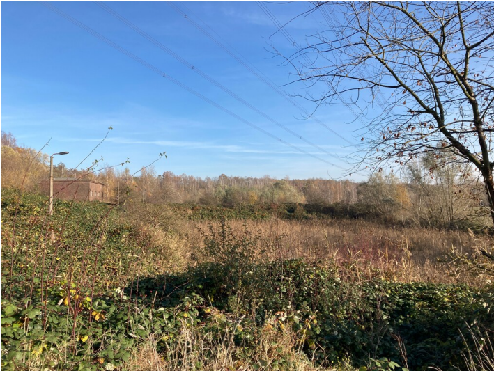
Teil der Objektgruppe ehemaliges Braunkohlenveredelungswerk Espenhain (30100035), Absetzbecken

Schlagwörter: Absetzbecken Fachsicht(en): Denkmalpflege Gemeinde(n): Rötha Kreis(e): Leipzig Bundesland: Sachsen