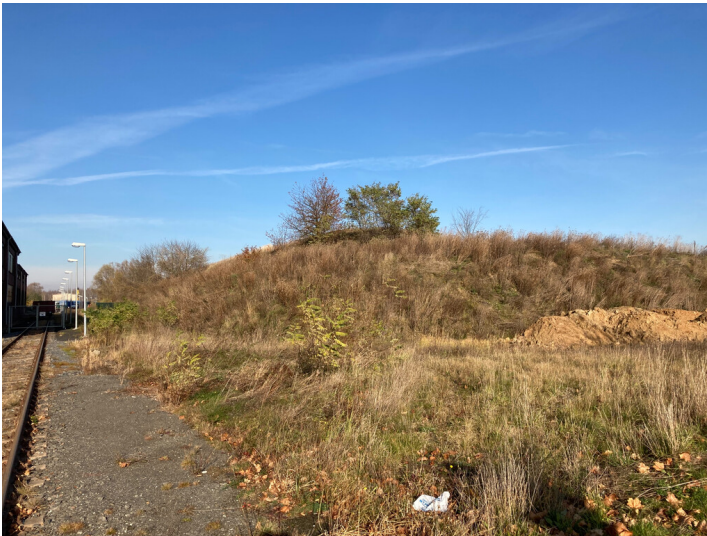
Teil der Objektgruppe ehemaliges Braunkohlenveredelungswerk Espenhain (30100035), Hochbunker 2 des ehemaligen Braunkohlen- und Großkraftwerk Espenhain