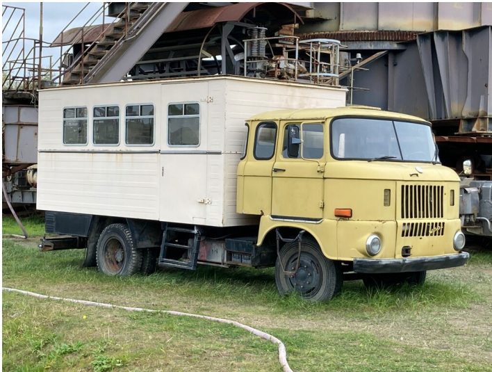
Teil der Objektgruppe Bergbau-Technik-Park (30600134), IFA W50