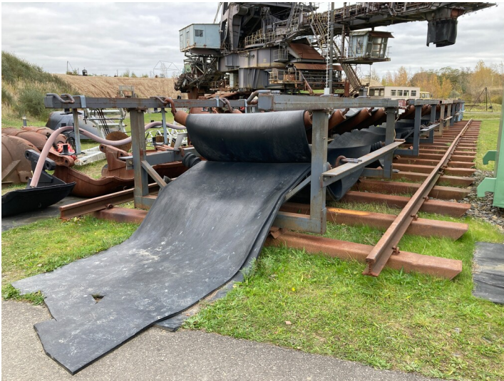
Teil der Objektgruppe Bergbau-Technik-Park (30600134), rückbare Bandanlagen