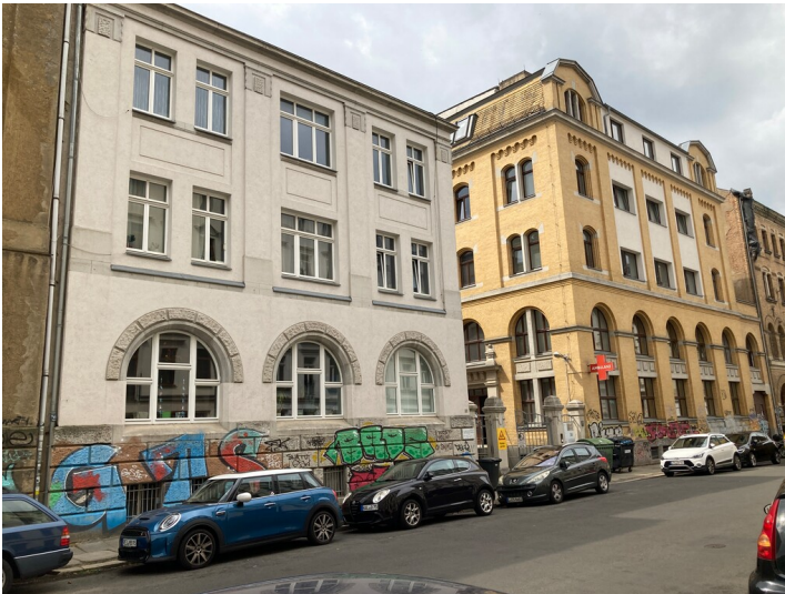
nördliche Giebelseite des Umspannwerkes und benachbarten Beamtenwohnhauses aus nordöstlicher Richtung