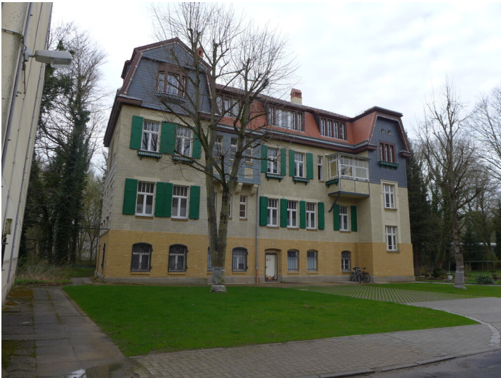
Eingangsseite des Verwaltungsgebäudes, aus nördlicher Richtung